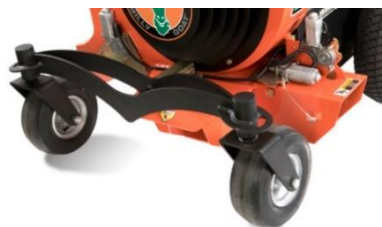
Essieu avant tordu pour une conduite confortable sur des obstacles