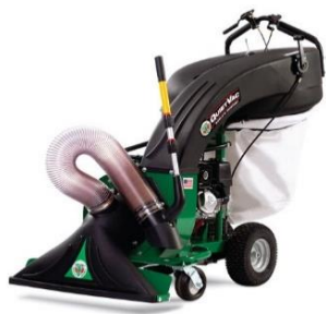
QV-series, avec tuyau d'aspiration optionnel