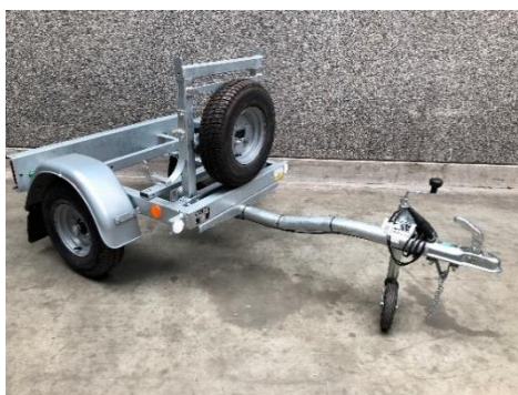
Remorque sur mesure