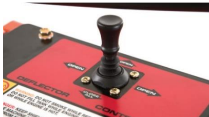
Commande du déflecteur par joystick