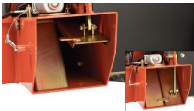
Système Dual Deflector Air Flow: flux d'air divisé à gauche