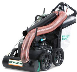
MV-series, avec tuyau d'aspiration optionnel