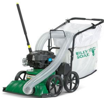
KV-series, a/ tuyau d'aspiration optionnel