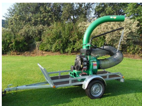
Remorque plateau de charge