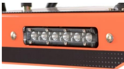
Eclairage de travail LED à l'avant