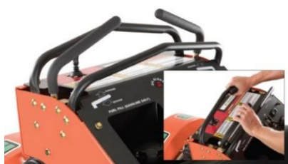
Système Quad Control Handle